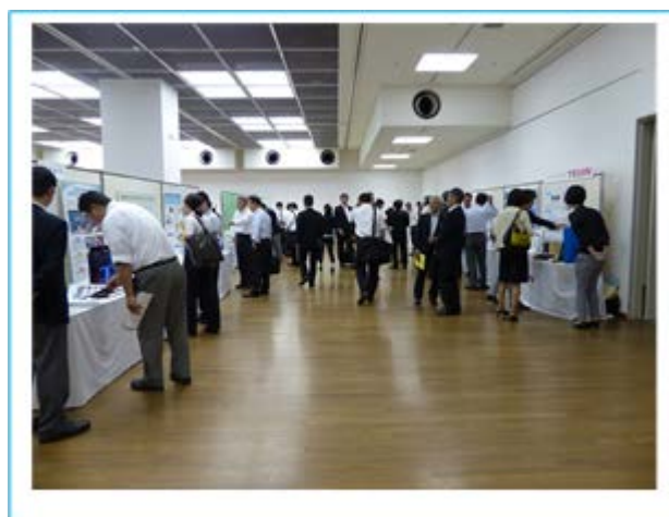
昨年度の展示会場風景